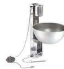
Explosión de aceite

Utilizar únicamente con los aerosoles LEADER. Alto: 22,5 cm / Ancho: 26 cm / Pr.: 20 cm / Peso: 6,9kg