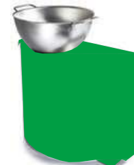
Fuego de freidora

Se fija en el módulo Pantalla plana (ref.: V90.80.071). Alto: 35,5 cm / Ancho.: 39,5 cm / Pr.: 18,0 cm / Peso: 2,9 kg