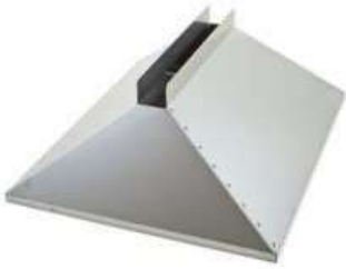
Adaptador para GF42 y AEROS 2

Necesarios para la instalación de los módulos de formación - Garantía: 1 año