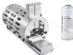
Explosión de aerosol

Alto: 35,5 cm / Ancho: 32,5 cm / Pr.: 56 cm / Peso: 6,8 kg