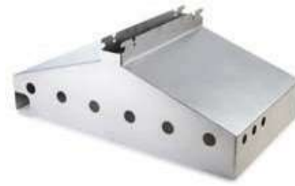
Adaptador para PYROS 3

Alto: 27,5 cm / Ancho: 71,0 cm / Pr.: 61,5 cm / Peso: 8kg