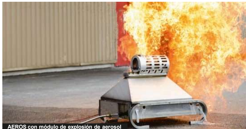
AEROS con módulo de explosión de aerosol

1 puerta con llave amovible que se fija sobre el módulo de Pantalla plana (Ref.: V90.80.071). Alto: 38,0 cm / Ancho.: 46,5 cm / Pr.: 11,0 cm (base: 14,5 cm) Peso: 6,5 kg