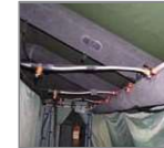
Tuberías de agua