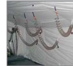
Tuberías de agua