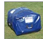
Tienda guardada en la bolsa