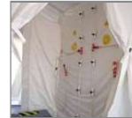
Tuberías de agua