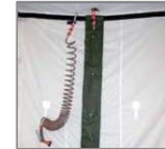
Tuberías de agua