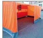
Porche para el contenedor