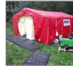
Tienda de ducha conaccesorios