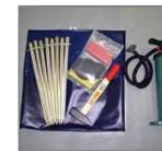
Accesorios de la tienda