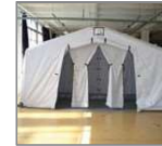
Tienda de ducha