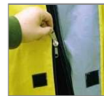
Acceso a la tienda