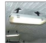
Fijación de iluminación