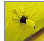
Orificio para la calefacción