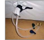
Suministro de agua a la tienda