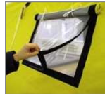
Ventana de trescapas