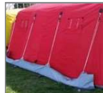
Saco de carga