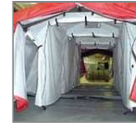
Tienda de ducha