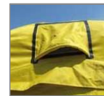
Rejilla de ventilación