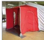
Pasillo deconexión tienda-contenedor